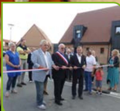
42 logements en 2016