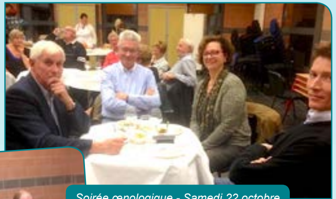
Soirée œnologique - Samedi 22 octobre