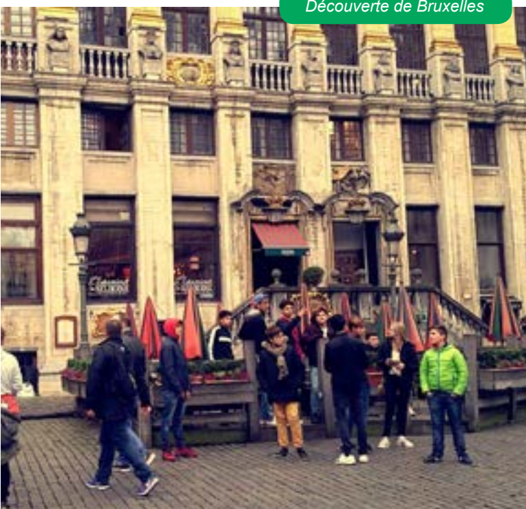
Découverte de Bruxelles

L'ensemble du groupe s'est réuni le jeudi 27 octobre au soir pour fêter Halloween . Ils ont, avec l'aide de leurs animateurs, préparé et dégusté un bon repas. Ensuite ils ont participé à des jeux d'Halloween et pour finir la soirée se sont retrouvés devant un écran géant pour visionner un film d'épouvante « SAW ».