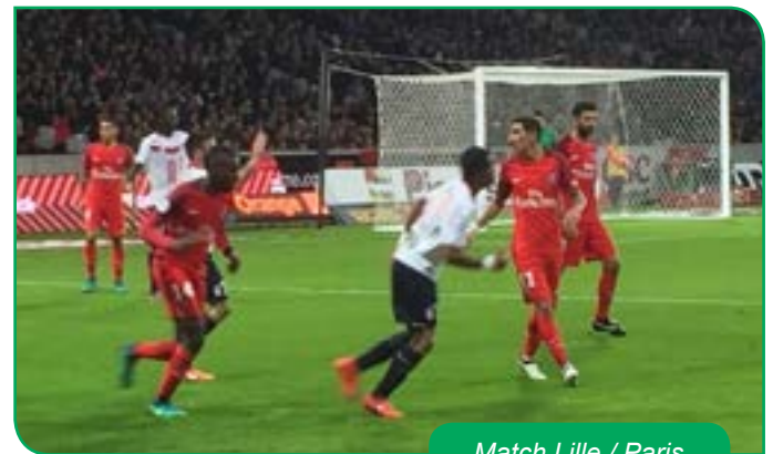
Match Lille / Paris

À l'issue de la représentation, un débat sur le thème de la justice a eu lieu entre nos jeunes Waziérois et les spectateurs. Ce projet est à reconduire avec de nouveaux publics