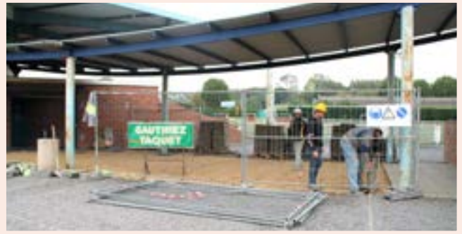
Préparation du chantier de la salle de convivialité