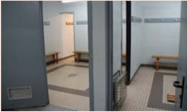
Remise en peinture des douches et vestiaires