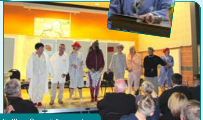
Théâtre « Rions un peu, beaucoup, passionnément, à la folie !!! » - Samedi 5 novembre