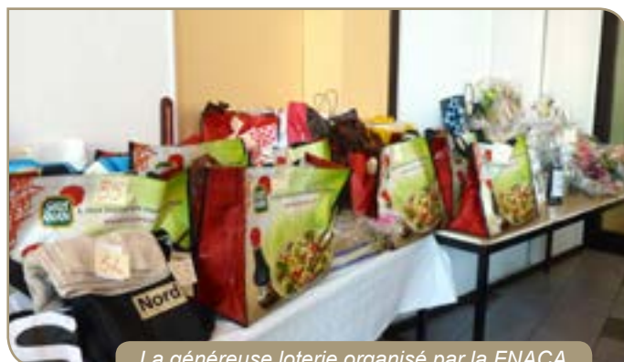
La généreuse loterie organisée par la FNACA lors de son AG a connu un vif succès !