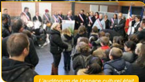
L'auditorium de l'espace culturel était comble en ce jour de Souvenir