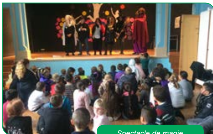
Spectacle de magie

Les vacances se sont terminées par un spectacle de magie.