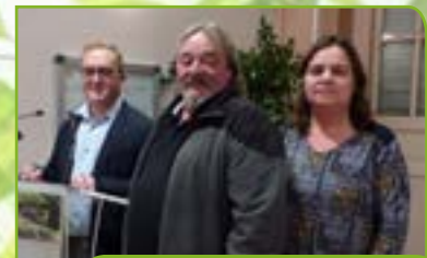
Façades : M. Philippe PILIA