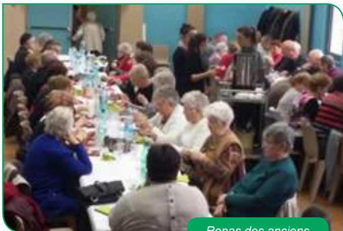
Repas des anciens