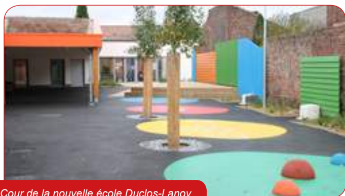
Cour de la nouvelle école Duclos-Lanoy

N'oubliez pas, ayez toujours à l'esprit, que notre ville de Waziers, est une ville connue et reconnue pour son vivre ensemble, un vivre ensemble si précieux et en même temps si fragile, pour sa solidarité alors soyez fiers d'habiter dans cette ville, soyez fiers, comme nous, nous sommes fiers d'être au service de cette ville, d'être à votre service, soyez tout simplement fiers d'être Waziérois.