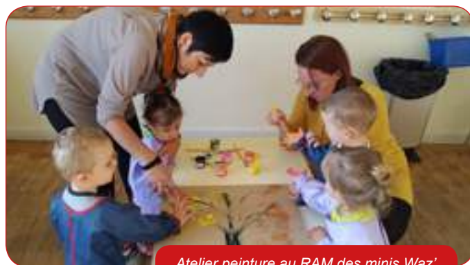
Atelier peinture au RAM des minis Waz'