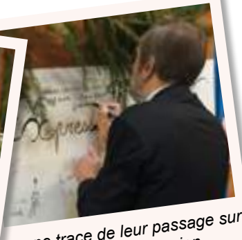
...une trace de leur passage sur le mur de libre expression.