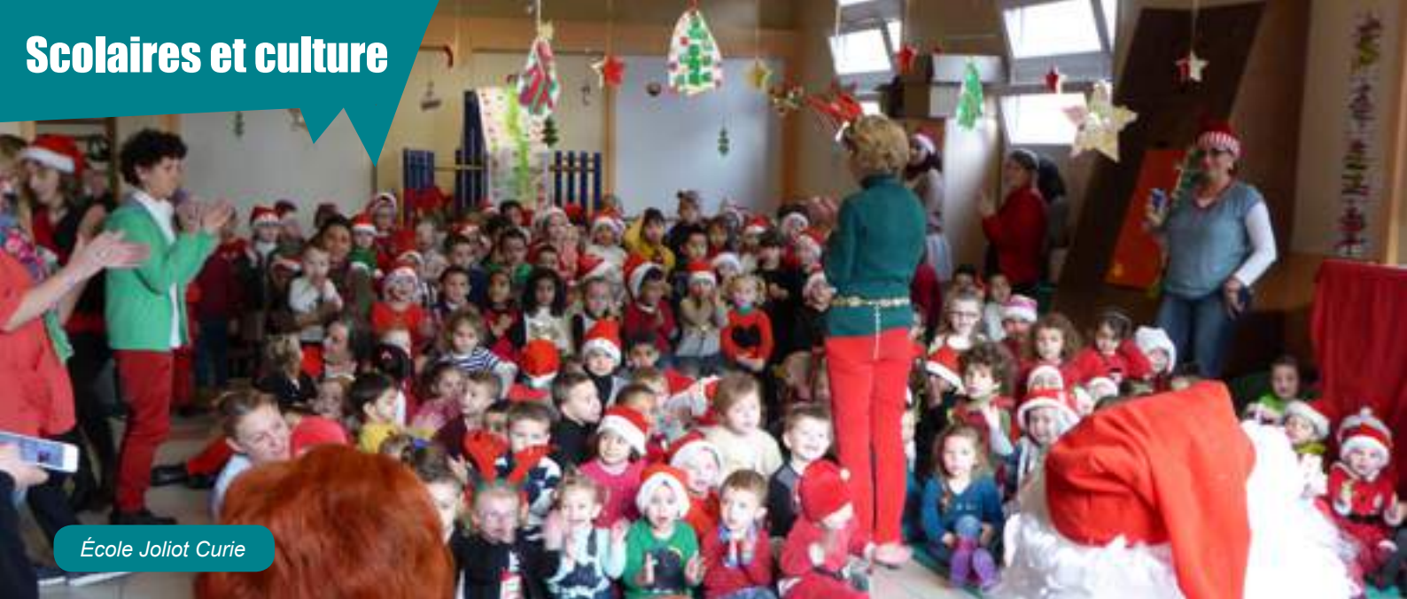
École Joliot Curie