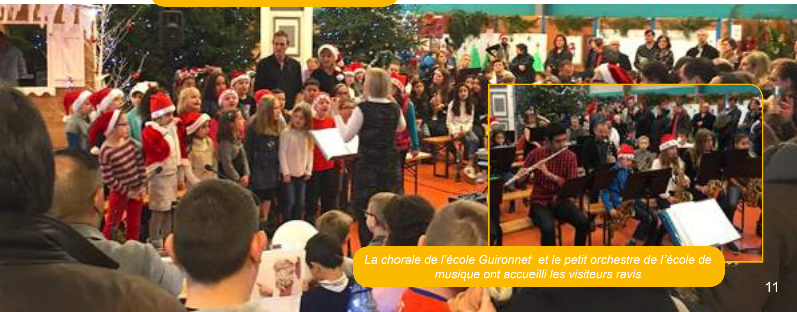
La chorale de l'école Guironnet et le petit orchestre de l'école de musique ont accueilli les visiteurs ravis