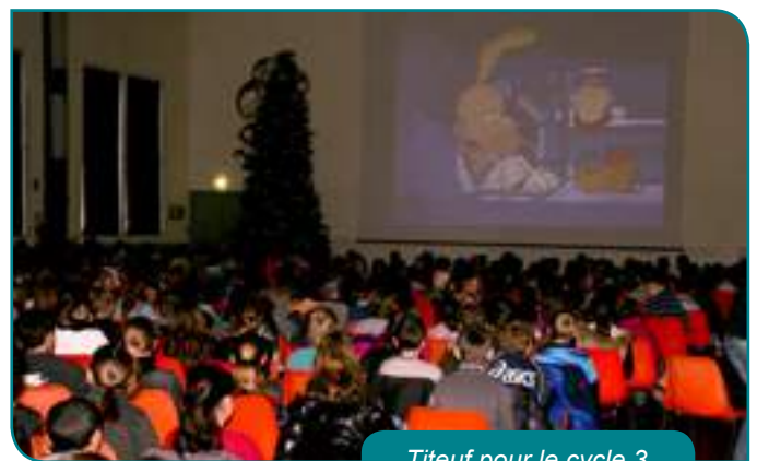
Titeuf pour le cycle 3

Pour les primaires, soit plus de 630 élèves, deux films étaient à l'affiche :