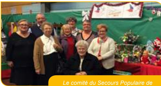
Le comité du Secours Populaire de Waziers a tenu un stand