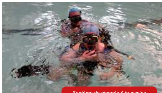
Baptême de plongée à la piscine

Tiens, je me rappelle cette déclaration, dans la presse, au lendemain de cette même cérémonie, l'année dernière, une déclaration reflétant une frustration plutôt qu'un