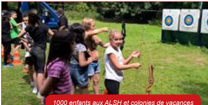
1000 enfants aux ALSH et colonies de vacances

L'amertume des résultats électoraux de 2015, des Départementales et des Régionales qui ont vu des scores sans précédent de l'extrême droite. Comme je l'ai déclaré aux Waziérois, il y a des moments où il faut se parler franchement, où il faut réfléchir à haute et intelligible voix.