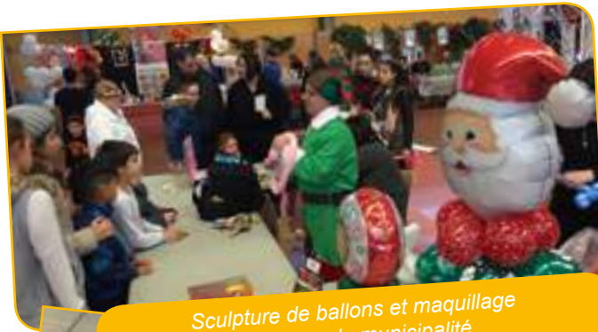
Sculpture de ballons et maquillage offerts par la municipalité