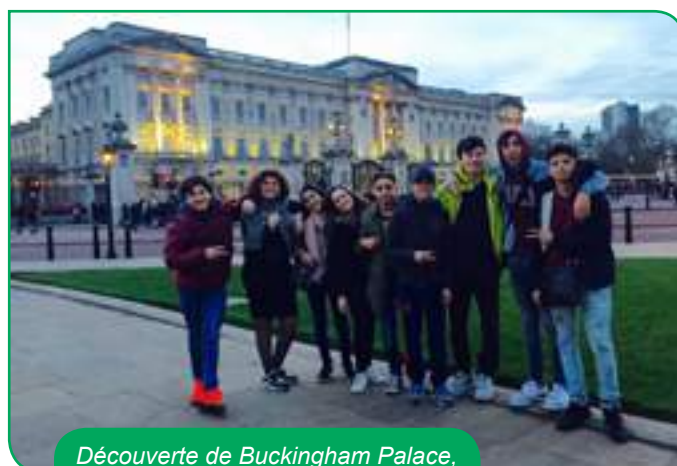
Découverte de Buckingham Palace, le château de la famille royale

À tout cela s'ajoute un séjour à Londres pour 22 d'entre eux, séjour qu'ils ont en parti autofinancé en menant depuis septembre diverses actions.