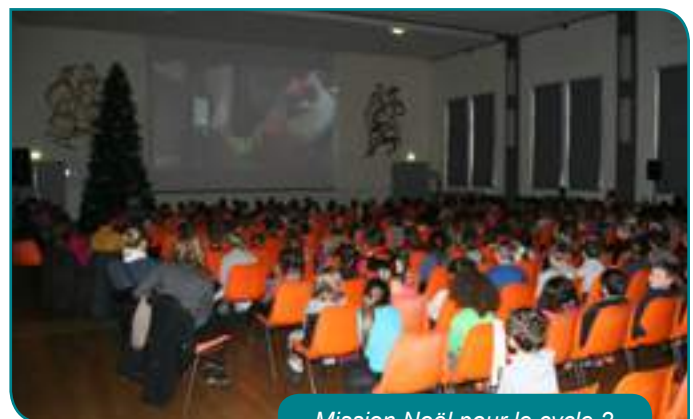
Mission Noël pour le cycle 2

La commission des affaires scolaires, souhaite une très bonne année à tous ces enfants.