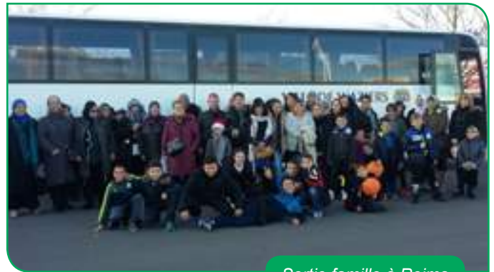
Sortie famille à Reims