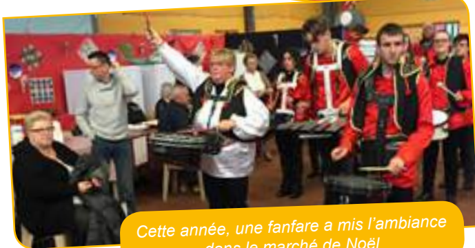
Cette année, une fanfare a mis l'ambiance dans le marché de Noël

Après l'accueil des élus et l'aubade des enfants de l'école de musique municipale, chacun a pu déambuler à son gré et profiter des exposants, activités et jeux proposés pour petits et grands.