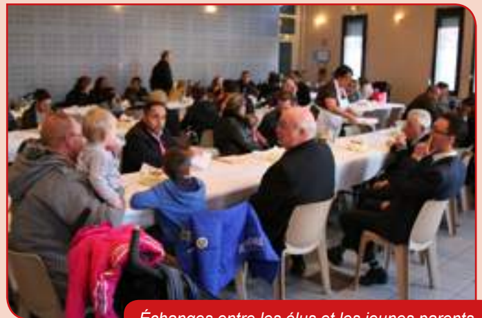
Échanges entre les élus et les jeunes parents.

Le but étant de marquer cette naissance en laissant un souvenir utile et agréable, en créant un moment de convivialité avec les jeunes parents. Le livre remis aux parents à plusieurs vocations : inscrire un certain nombre de dates importantes, des renseignements... Il comporte diverses informations utiles à destination des parents et de l'enfant.