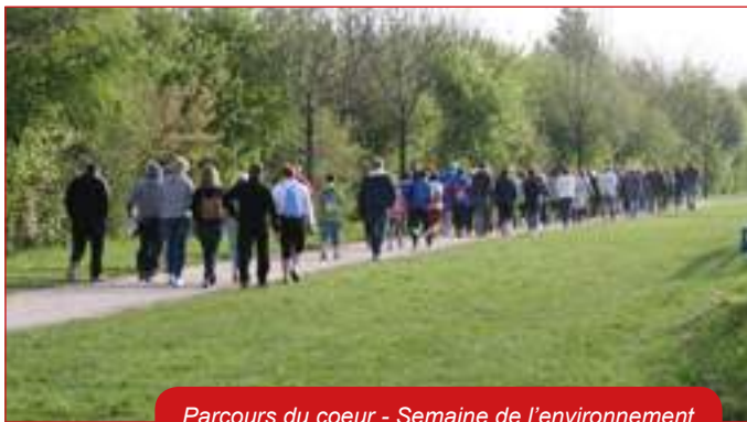
Parcours du coeur - Semaine de l'environnement

Ne pas avoir ce courage c'est entretenir le terreau sur lequel se développe le vote Front National.