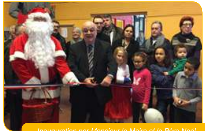
Inauguration par Monsieur le Maire et le Père Noël