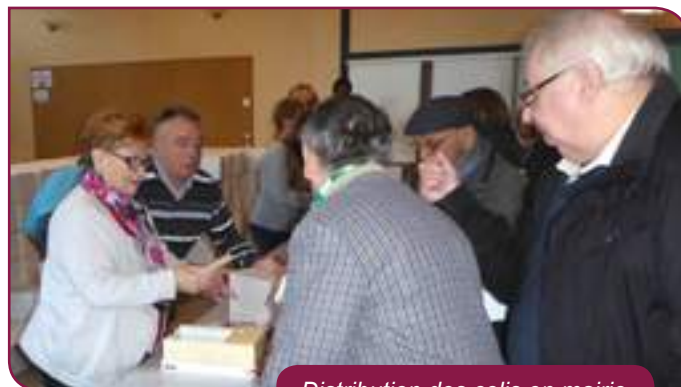
Distribution des colis en mairie

Au total, 1100 colis ont été offerts aux personnes de plus de 65 ans.