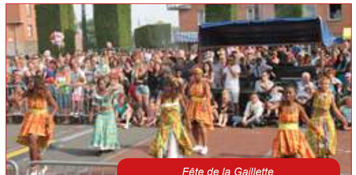
Fête de la Gaillette

De la compassion, pour la plupart de nos compatriotes qui encore cette année ne voient pas leur situation personnelle beaucoup évoluer. La courbe du taux de chômage n'est toujours pas inversée. Les salaires, les pensions, les revenus en général continuent de stagner et se concluent par une perte du pouvoir d'achat. Pas de coup de pouce pour le SMIC, quelques centimes d'euros pour les retraites ce qui ressemble à du mépris pour les anciens ! La santé toujours autant menacée avec le déremboursement de plus en plus de médicaments.